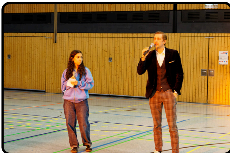
Bild vom Hallensportfest 2024